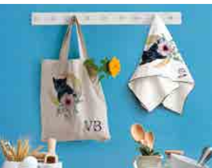
ACCESSORI E REGALI